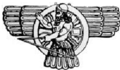
Schamasch als Adler und mit Sonnenrad

Die Legende besagt, dass bei der Wiedereinweihung im Tempel nur geheiligtes Öl für einen Tag vorgefunden wurde. Neues herzustellen hätte acht Tage gedauert. Trotzdem wur-