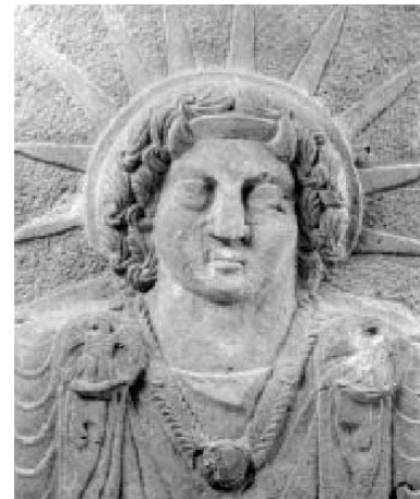
Schamasch mit Mithraskrone

Schamasch ist der Sohn von Suen, dem Mondgott und seine Begleiter sind seine Söhne Mesharu Recht und Kettu Gerechtigkeit . Ishtar Ostara , die Göttin der Liebe ist seine Schwester. Sie gibt dem christlichen Osterfest ihren Namen. Sein wichtigstes Symbol ist das Sonnenrad, denn der Sonnengott Schamasch zieht mit Ross und Wagen über den Himmel. Schamasch wird auch oft als Adler dargestellt; ein weiteres Haupt-Motiv im Sonnenkult. Wir lesen davon, dass Israel zeitweise dem Sonnenkult des Schamasch verfallen war. Eine Ortschaft heisst sogar bis heute Beth-Schemesch Haus der Sonne .